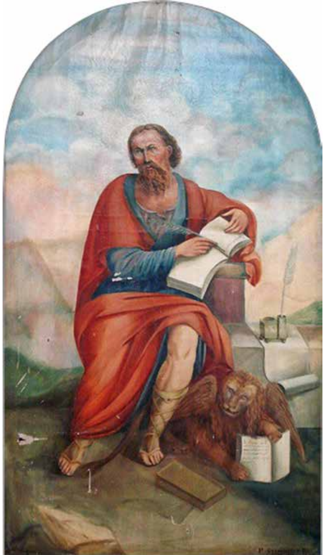
Foto: St. Mark, City Museum of Caxias do Sul, Brazil

Seine erste Erwähnung findet sich in Apg 12,12 als Sohn einer reichen Levitenfamilie. Im Haus seiner Mutter Maria in Jerusalem versammelt sich die Urgemeinde. Später geht er mit dem Apostel Paulus und Barnabas, seinem Cousin (vgl. Kol 4,10) auf die erste Missionsreise (Apg 12,25). Aus einem uns unbekanntem Grund wollte ihn Paulus aber nicht mit auf die zweite Missionsreise nehmen. Darüber kam es tatsächlich zu einem Streit mit Barnabas, der sich offensichtlich Markus verpflichtet fühlte – sodass sich die Wege